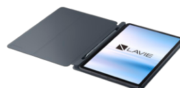
※本体・ペン装着時