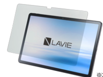
※本体装着イメージ

■ ガラス保護フィルム (PC-AC-AD048C) 高透過率&防指紋加工で快適