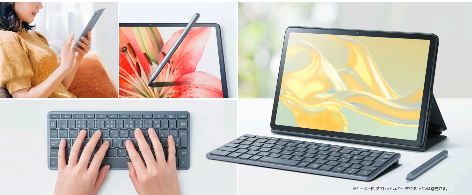
※キーボード、タブレットカバー、デジタルペンは別売です。